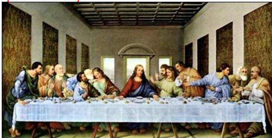
Фреска - «Тайная вечеря»

Обе картины по своей сути являются противоположностями, на одной запечатлен момент оглашения о предательстве Иисуса Христа, и бурное негодование по этому поводу всеми апостолами, а на другой Тотальное и Безоговорочное Признание абсолютно всеми Людьми из всех стран и континентов находящимся на нашей Красивой и Замечательной Земле, самого Иисуса Христа и Бога Единого! и их счастливый, для всех Людей Божий МiP , который состоится, и будет вечно пребывать, и поддерживаться всеми людьми на нашей Матери-Земле!